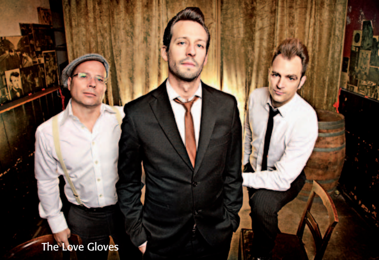
The Love Gloves